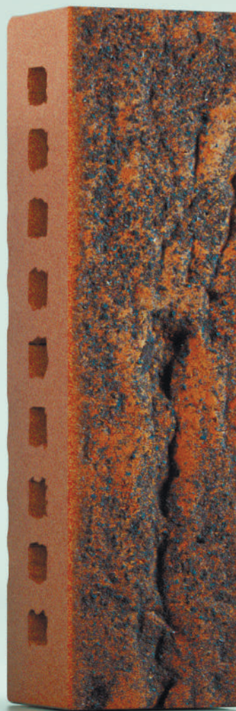
Формат 0.5 NF

Размер 215x102x65 Масса 2,55 кг На поддоне 428 шт. Расход 59 шт/м 2